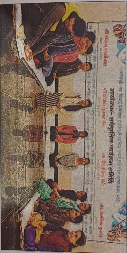
अमरोहा के जेएस हिंदू पीजी कॉलेज में युवा महोत्सव में कार्यक्रम प्रस्तुत करते छात्र-छात्राएं।