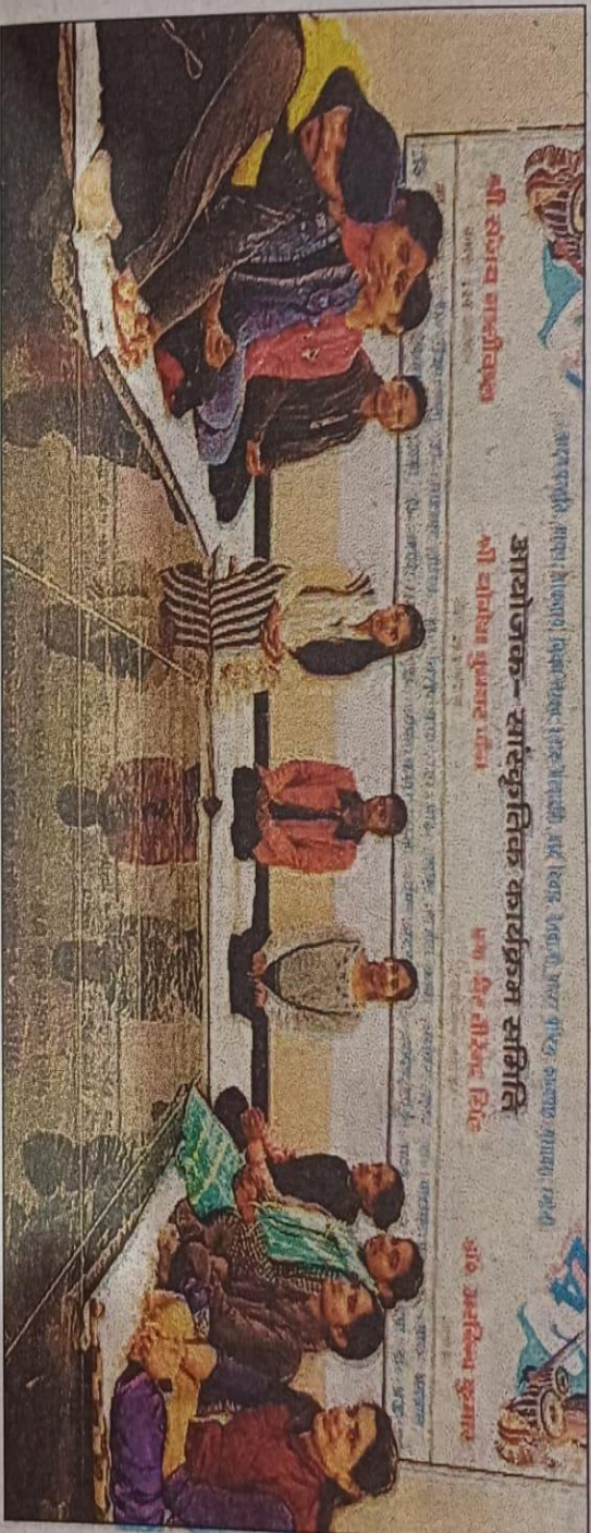
अमरोहा के जेएस हिंदू पीजी कॉलेज में युवा महोत्सव में कार्यक्रम प्रस्तुत करते छात्र-छात्राएं।