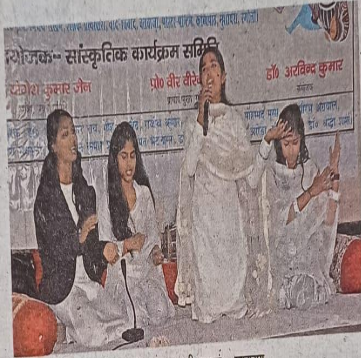
युवा महोत्सव कार्यक्रम में कव्वाली प्रस्तुत करती छात्राएं