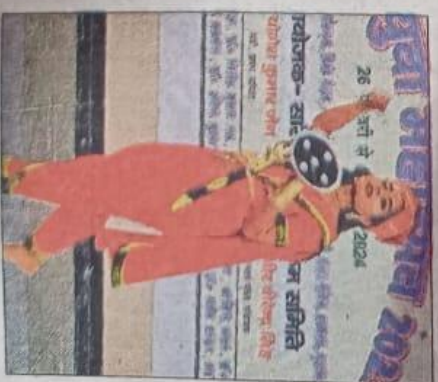
युवा महोत्सव में सांस्कृतिक कार्यक्रम पेश करती छात्रा।