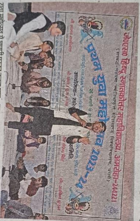
युवा महोत्सव में शायरी प्रस्तुत करता छात्र