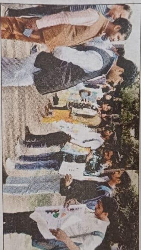
जेएस हिंदू पीजी कॉलेज में युवा महोत्सव में अपने पोस्टर के साथ विद्यार्थी।